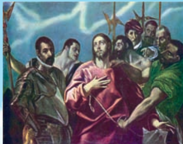
El Greco: Christus wird seiner Kleider entraubt