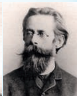
Heinrich von Herzogenberg