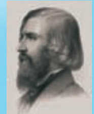
Albrecht von Graefe