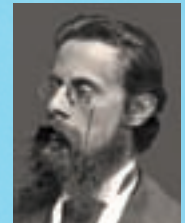
H. von Herzogenberg